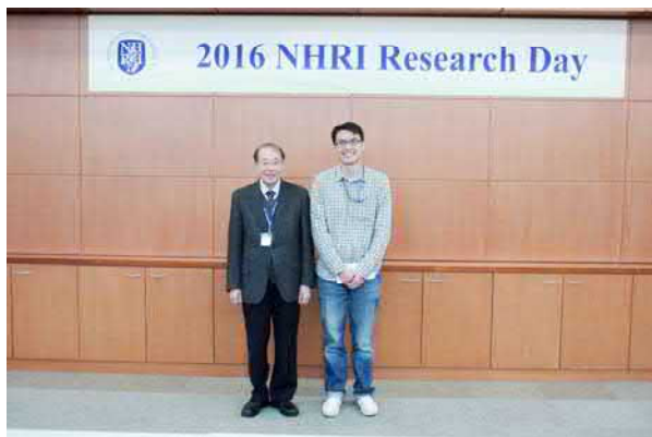
《口頭報告傑出獲獎人與余代理院長合影》