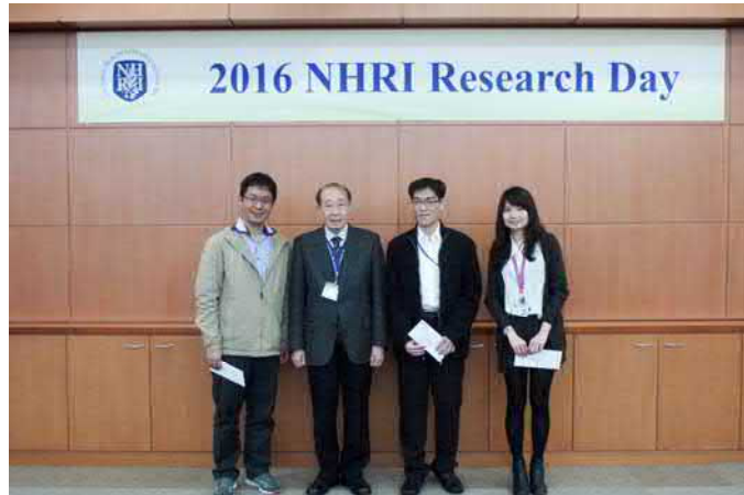
《口頭報告優選獎獲獎人與余代理院長合影》

研究內容之新穎發現為參與五碳醣磷酸路徑之一重要酵素核糖 5 磷酸異構酶過度表現於大腸直腸癌中，藉著穩定 \beta -catenin 並進核與 \beta -catenin 形成複合體進而促成腫瘤發生。原本已知核糖 5 磷酸異構酶 (Ribose-5-Phosphate Isomerase, RPIA) 參與在五碳醣磷酸路徑 (Pentose Phosphate