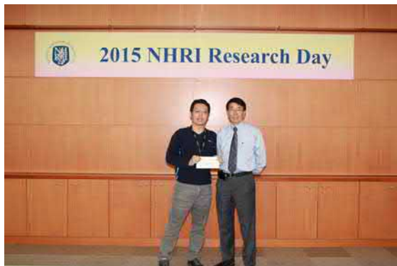
《口頭報告傑出獎獲獎人與龔院長合影》

目前在細胞及系統醫學研究所裘正健研究員實驗室進行博士後研究。 動脈粥狀硬化最易發生於血流紊亂處，例如動脈血管分岔處，而相較於直段血管處，分岔處的血流型態屬於低速的擾流，其產生之震盪型剪力證實可誘發動脈粥狀硬化，但擾流參與血管功能異常或病變之分子調控機制仍未被研究及釐清。研究團隊利用實驗用豬模式及高能分析技術磷酸化蛋白質質體學，針對血管分岔處及直行段偵測受到不同血液剪力影響的內皮細胞，找到約 1000 個受剪力調控的磷酸化胺基序列，其中系帶蛋白 Vinculin 的絲胺酸 Serine 第 722 位(Vin S722P )受到擾流刺激後，具有高度磷酸化的現象。進一步，我們利用人體基因組資料庫、新穎體外流體系統與螢光共振能量轉移技術(FRET)，找到擾流誘發上游調控磷酸酶 \beta -adrenergic receptor kinase (GRK2)活化，直接影響 Vin S722P 的累積，導致 Vinculin 的蛋白質結構關閉，使得 Vinculin 與連環蛋白( \alpha/\beta -catenin)和鈣黏蛋白(VE-cadherin)脫離，最後造成內皮細胞間隙打開。不僅如此，研究團隊再結合體內動物疾病模式，包括動脈硬化小鼠、大鼠之腹部主動脈再狹窄模式，並與患有冠狀動脈粥狀硬化換心病人的臨床檢體比較證實，擾流藉由活化 GRK2 與磷酸化 Vinculin 導致血管分岔處內皮細胞間隙蛋白打開後，影響內皮層通透性增加，而如此通透性增加與動脈硬化斑內巨噬細胞的累積，呈現正向關聯性。此研究揭露擾流誘發 GRK2 活化與新穎磷酸化蛋白 Vinculin 生成，為動脈粥狀硬化形成之重要生物標記與機制。